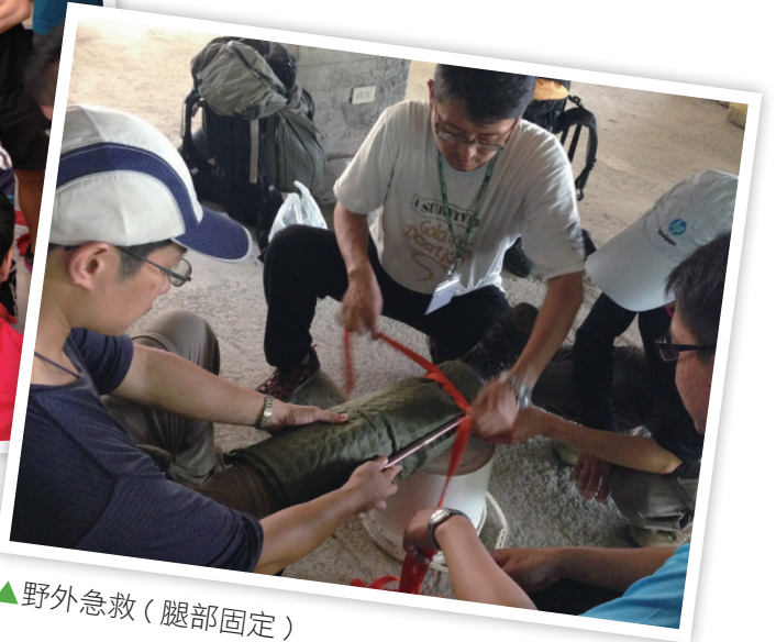
▲野外急救（腿部固定）