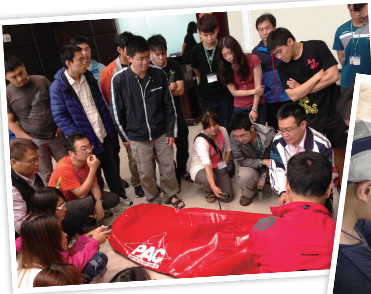
▲高山症及 PAC 加壓袋介紹