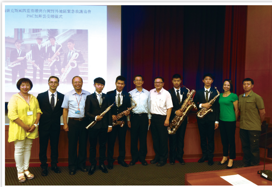
▲本會理事長（左6）與康橋雙語學校校長（右5）、本會秘書長（右1）、薩克斯風四重奏同學、指導老師（左2）及相關協力人員合照留念