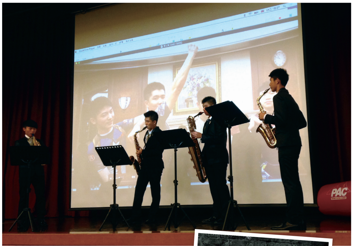
▲現場的薩克斯風表演，令人著迷！